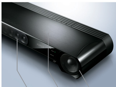
22개 빔 드라이버 고품질 알루미늄 캐비닛은 불필요한 진동을 억제합니다. 6.5cm 풀레인지 콘 우퍼

사운드바는 22 어레이 스피커를 야마하의 YSP 기술로 제어하며 깨끗한 빔은 고품질 서라운드 사운드를 제공합니다. 대형 캐비닛에는 2개의 강력한 6.5cm 우퍼유닛을 통해 음질을 개선하는데 도움을 줍니다. 알루미늄 바디는 불필요한 진동을 억제합니다. 그 결과 뛰어난 이미징의 프레젠테이션과 함께 우수한 서라운드 사운드의 음장을 제공합니다.