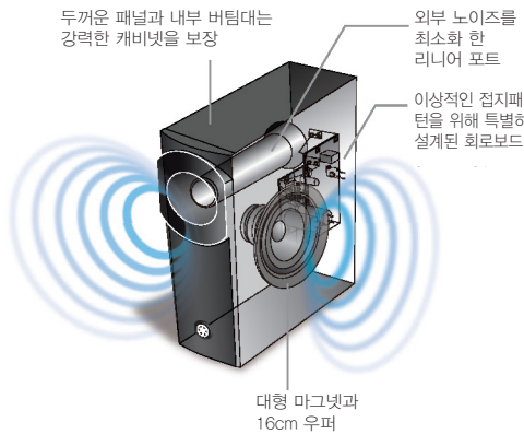
두꺼운 패널과 내부 버팀대는 강력한 캐비닛을 보장 외부 노이즈를 최소화 한 리니어 포트 이상적인 접지패턴을 위해 특별히 설계된 회로보드 대형 마그네틱과 16cm 우퍼

서브우퍼는 대형 16cm 드라이버를 사용하여 명확하고 강력한 베이스를 재현하는 야마하 고유의 Advanced YST 기술을 사용합니다. 이상적인 접지패턴을 위한 회로 보드는 안정적인 전류 공급을 보장합니다. 리니어 포트는 사운드의 분산을 항상 시키고 불필요한 소음을 최소화하도록 설계되었습니다. 음향효과는 음악과 영화 모두 놀라운 존재감을 느낄 수 있도록 재현합니다.